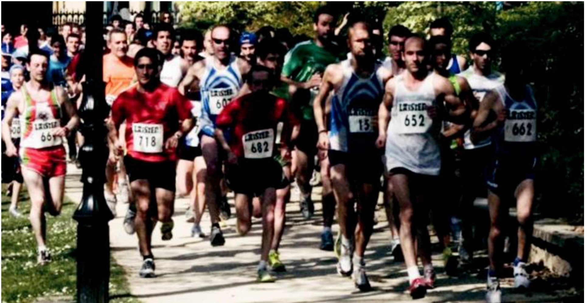
Ehundik gora korrikalarik hartu zuten parte iazko ekitaldian. SUDUR KROSSA

Oztopoak jarri dizkioten arren, aurrera egin du Sudur Krossak eta larunbatean jokatuko dute bigarren urtez jarraian, Egiako parkean barrena sei kilometroko bidea eginez.