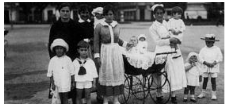
Garaiko familia bat.