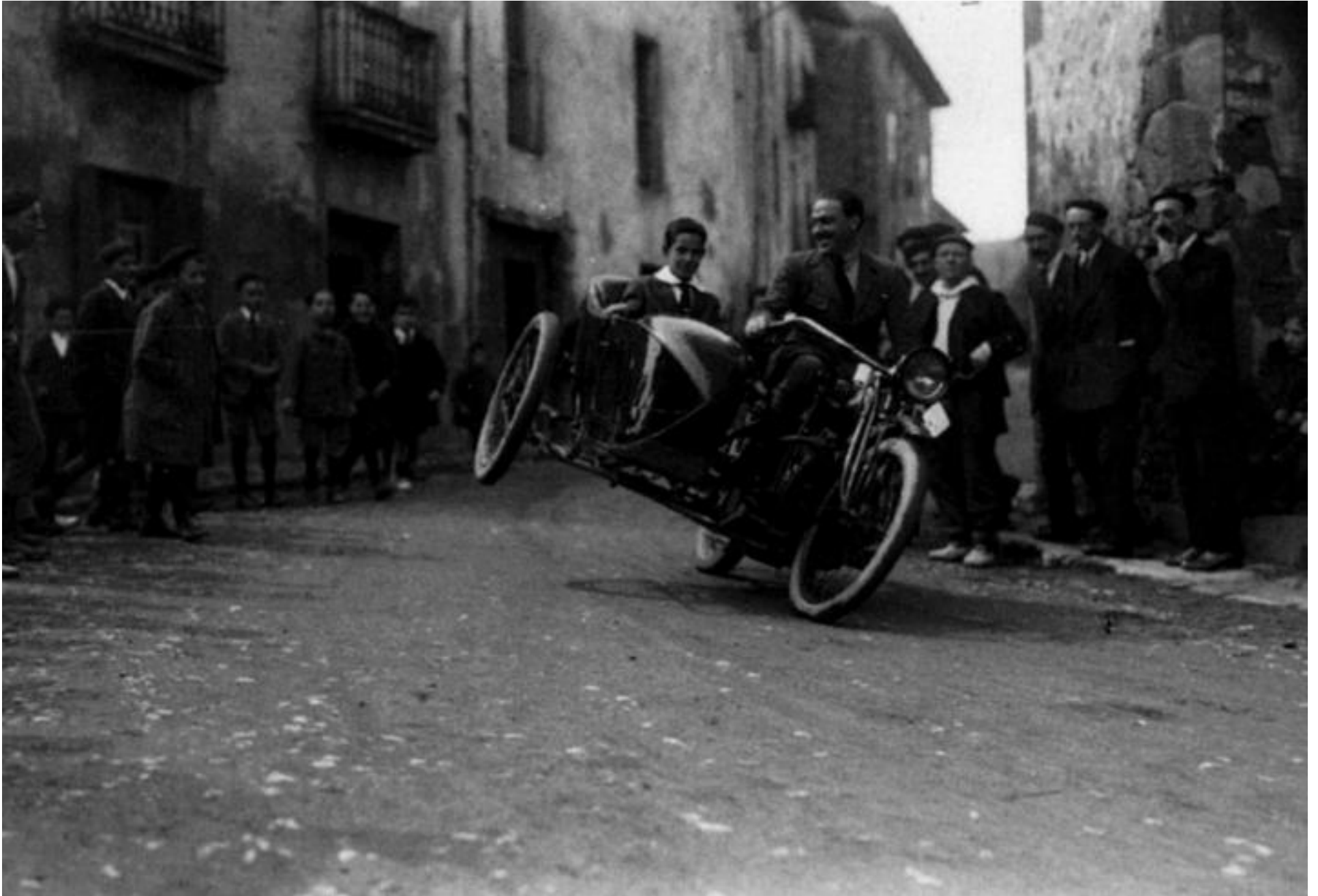
'Novedades'-ek argazki artistikoak zein dokumentalak biltzen zituen.

'Novedades' Donostiako lehen aldizkari grafikoetako bat izan zen; egun, hark utzitako irudien informazioari esker joan den mende hasierako gure gizartea nolakoa zen jakin dezakegu.