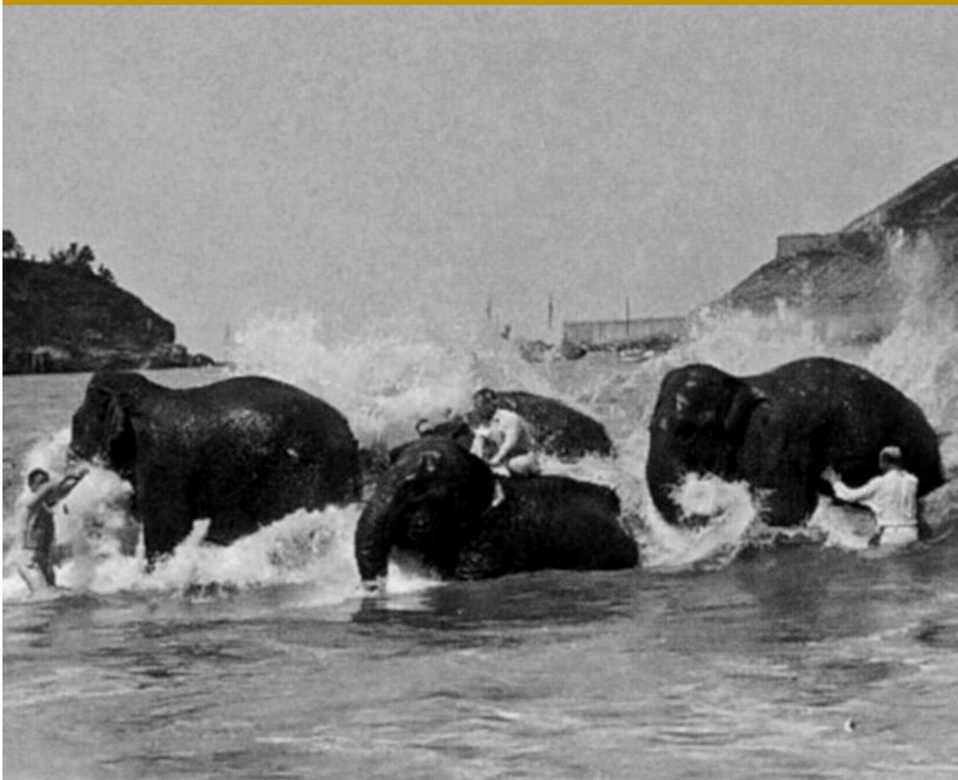
Elefanteak, Kontxako hondartzan, joan den mendearren hasieran.