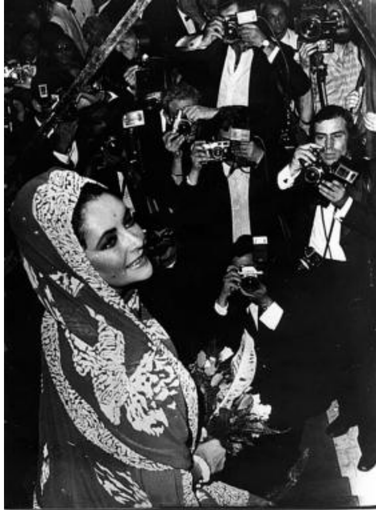
Elizabeth Taylor, Victoria Eugenia Antzokiko eskaileretan, saria jantzita eta argazkilariek inguratuta.